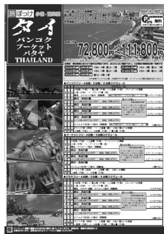
このパンフレットが対象です

小松発 富山発 あわせて 週7日 毎日運航！！ 増便で、新たに小松発バンコク6日間・パタヤ6日間・プーケット6日間が選べます！