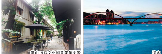
華山1914文化创意産業園区